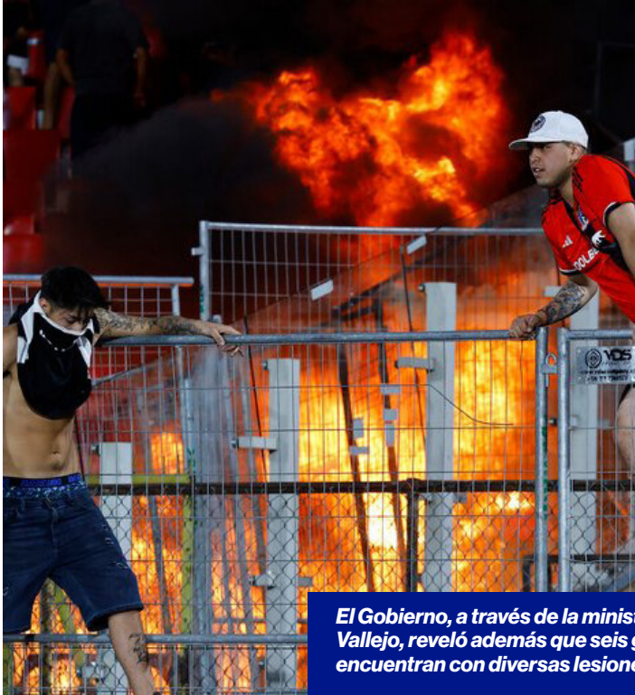
El Gobierno, a través de la ministra vocera de Gobierno, Camila Vallejo, reveló además que seis guardias y siete carabineros se encuentran con diversas lesiones por los desórdenes.

Este lunes, a raíz de los incidentes que tuvieron lugar el pasado domingo en el Estadio Nacional en medio del enfrentamiento entre Colo Colo y Huachipato, fue la ministra vocera de Gobierno, Camila Vallejo, quien se refirió a lo sucedido.