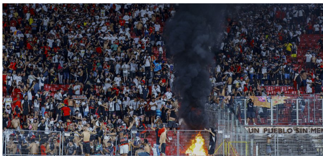
El ministerio del Interior y Seguridad Pública confirmó que 15 individuos pertenecientes a la Garra Blanca fueron detenidos durante los desórdenes ocurridos en el "coloso de Ñuñoa".

Otro de los capturados, de 31 años, que saltó una de las barreras de acceso y atacó a Carabineros